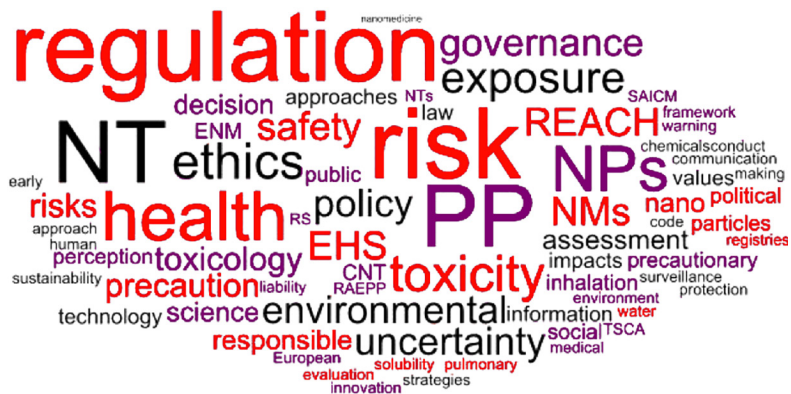
FIGURA 1. Nube de palabras, a partir de las palabras clave.