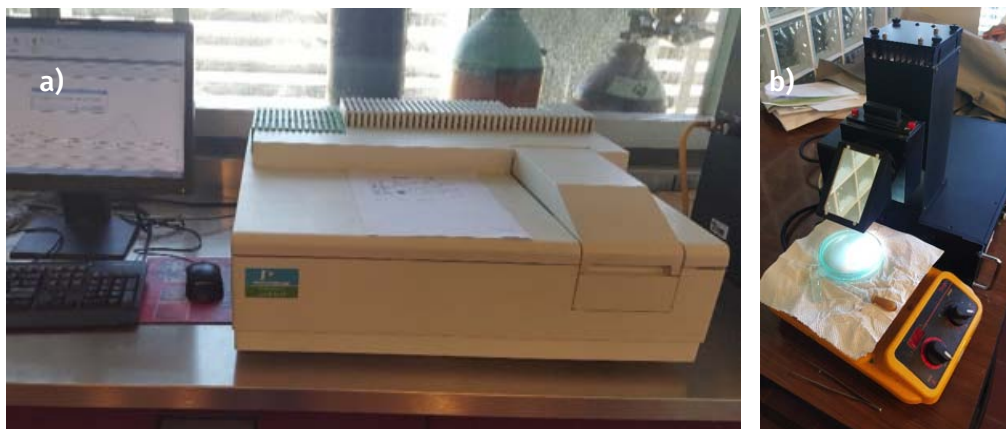
FIGURA 4. a) Espectrofotómetro Lambda 35 de Perkin Elmer; b) simulador solar Science Tech.

pectrofotómetro UV-vis lambda 35 de Perkin Elmer (figura 4a), un simulador solar marca Science Tech (figura 4b), un reactor de fotoquímica Q-200 Marca Prendo (figura 5a), autoclave (figura 5b), microscopio óptico digital, así como lámparas ultravioleta, rotavapor (figura 6 a), horno para calcinar (figura 6 b), equipo Soxleth, pHmetro, turbidímetro, microcentrífuga, equipo de fisisorción CHEMBET 3000 y un equipo de depósito por giro (figura 7b), entre otro instrumental y equipo de laboratorio menor que le han servido de apoyo para dar seguimiento al desempeño de las formulaciones catalíticas preparadas.