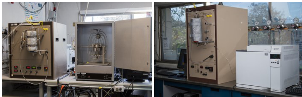
FIGURA 3. Los 2 equipos de evaluación catalítica en fase gas con que cuenta el Laboratorio Universitario de Nanotecnología Ambiental.

síntesis y evaluación catalítica de nanopartículas metálicas del grupo del platino y su comparación con compuestos organometálicos discretos y con compuestos dendriméricos organometálicos.