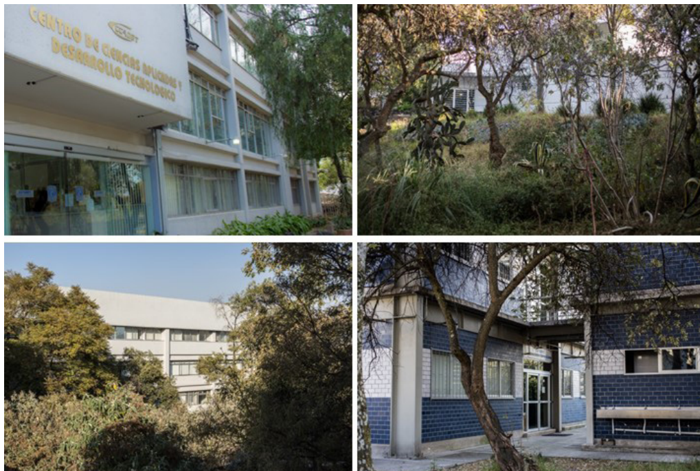
Figura 1. Instalaciones del Centro de Ciencias Aplicadas y Desarrollo Tecnológico en Ciudad Universitaria.

sión de la cultura, es una entidad multi e interdisciplinaria especializada en instrumentación científica e industrial, micro y nanotecnologías, tecnologías de la información, y enseñanza de las ciencias; conjunta su especialización en los campos arriba mencionados y dirige su experiencia a las áreas de salud, medio ambiente, energía, y educación. En el campo de conocimiento de las micro y nanotecnologías ( Mundo Nano. Revista Interdisciplinaria en Nanociencias y Nanotecnología , vol.9, núm.16) se estudia principalmente el desarrollo de nanomateriales y microdispositivos con aplicaciones en salud, medio ambiente y energía; películas delgadas; desarrollo de plataformas espectroscópicas para el estudio de interacciones moleculares; nanocatálisis y fotocatalisis; materiales nanoestructurados de carbono y materiales magnéticos suaves y nanoestructurados.