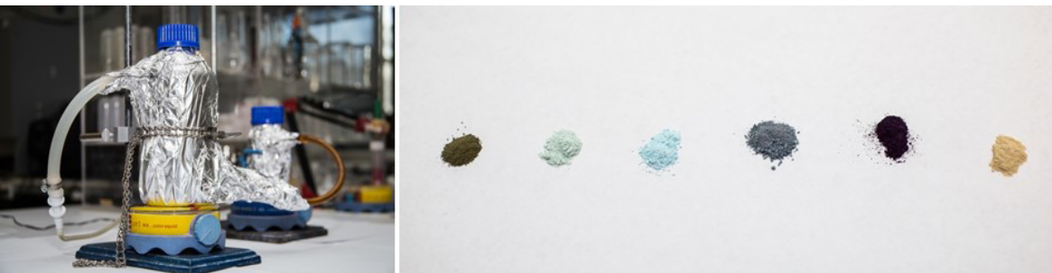
FIGURA 5. Reactores de doble pared utilizados para la síntesis de los catalizadores e imágenes de diferentes formulaciones de catalizadores tanto monometálicos como bimetálicos.

tal-sustrato. En algunos casos, los procesos de impresión 3D pudieran jugar un papel importante en el desarrollo de ciertos catalizadores con morfologías o formas específicas, que pudieran resultar favorables para incrementar la eficiencia de ciertos procesos.