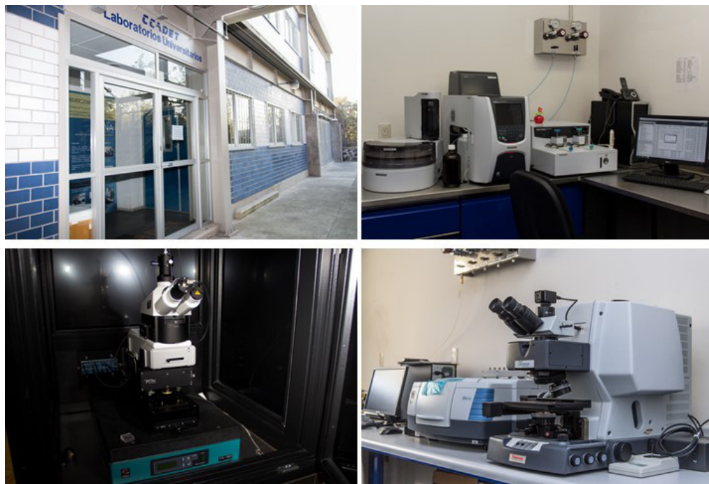
FIGURA 2. Los laboratorios universitarios en el CCADET y algunos de sus equipamientos.

micos que lo integran apoyan fuertemente la investigación que se realiza en catálisis heterogénea y fotocátalisis en el CCADET.