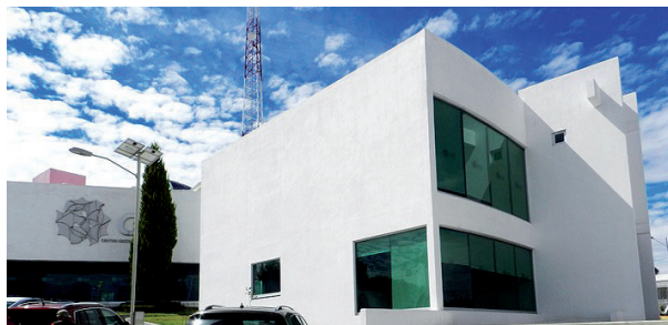
FIGURA 4. a) Entrada del edificio del CNS, y b) aspecto del clúster IBM iDataPlex dx360 M4 (rendimiento teórico de 107.568 Tera flops) y almacenamiento de 1.4 PB.