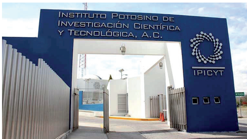
FIGURA 1. Entrada del Instituto Potosino de Investigación Científica y Tecnológica.

híbridos y biomateriales diversos son investigados tanto a nivel básico como en aplicaciones tales como la generación de fuentes alternas de energía, electrónica orgánica, sensores de gases, nanomedicina, inactivación de microorganismos patógenos, entre otros.