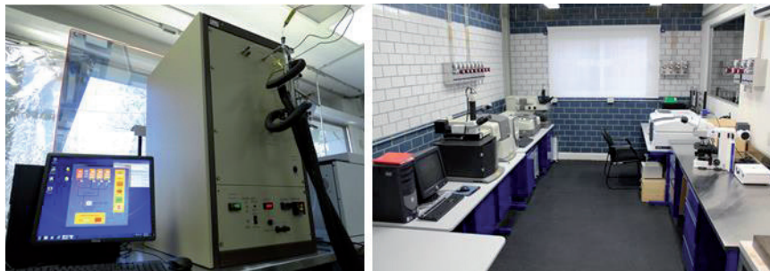
FIGURA 2. Equipo para evaluación catalítica de nanomateriales y su caracterización por técnicas espectroscópicas.