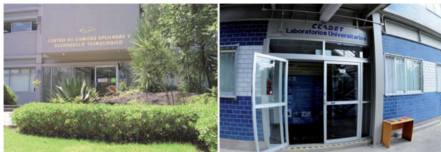
FIGURA 1. Entrada al edificio principal y del edificio de Laboratorios Universitarios del CCADET.

KEYWORDS: CCADET, lines of research, research projects, nanocatalysis, nanomaterials, carbon nanotubes