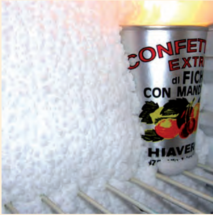
FIGURA. Gracias a una nueva tecnología por investigadores de Harvard que mantiene cualquier superficie metálica libre de hielo y la escarcha, la acumulación de escarcha en el congelador podría ser una cosa del pasado.